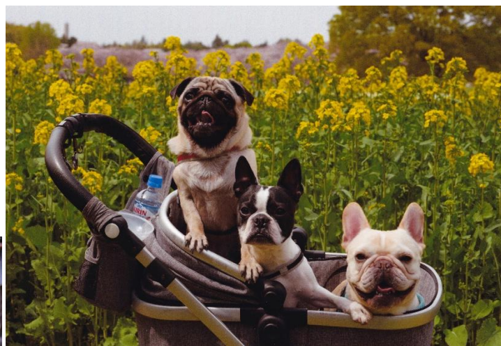
いっしょにおどりたいよ 豊島 久