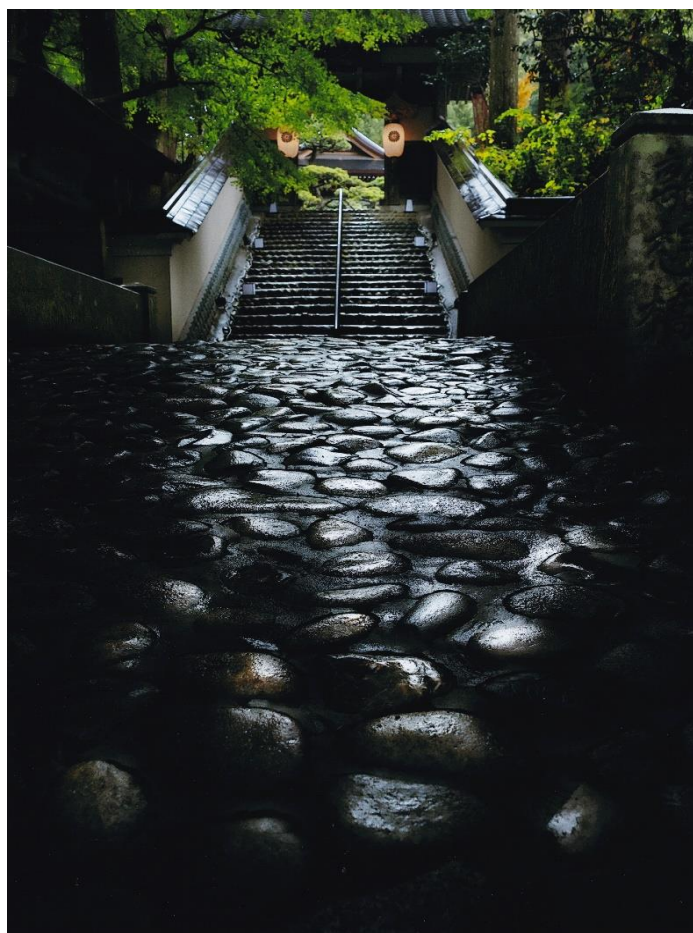
雨の参道 石井 登