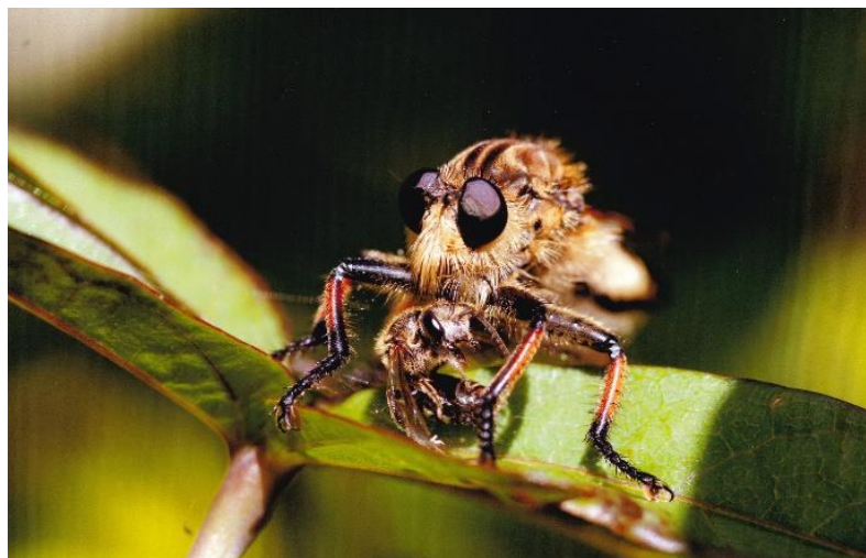
サングラス 豊島 久