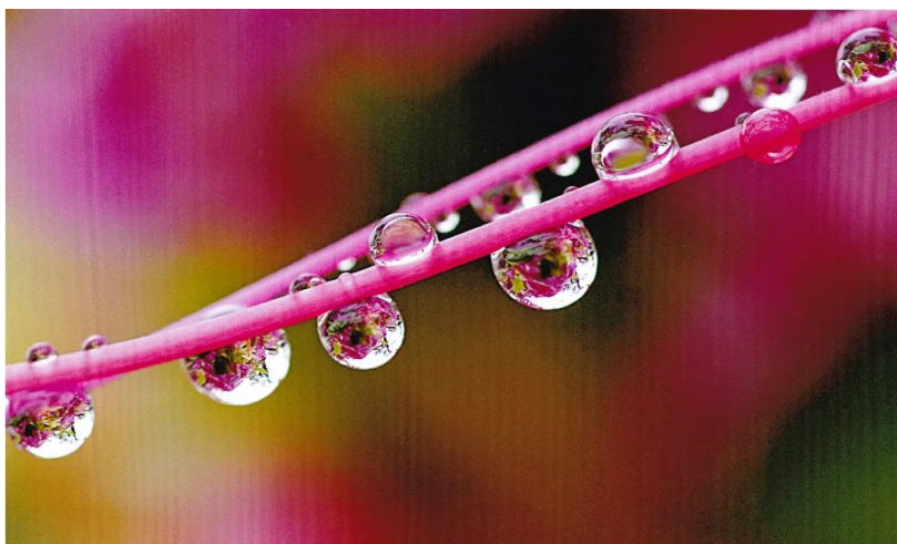
露中の花園 豊島 久